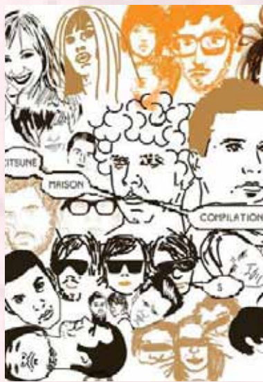
Kitsuné fashion brand