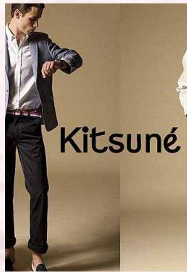
Kitsuné fashion brand